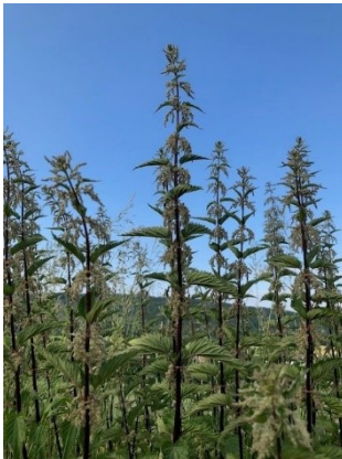
Brennnessel vor blauem Himmel in Rothemann

Ruhig sammle ich im Schoß Rosen und Lilien und alles Grün, während ich deine Werke preise.