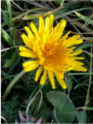
Löwenzahn aus unserem Garten

„Wenn ich mit offenen Augen betrachte, was du, mein Gott geschaffen hast, besitze ich hier schon den Himmel.